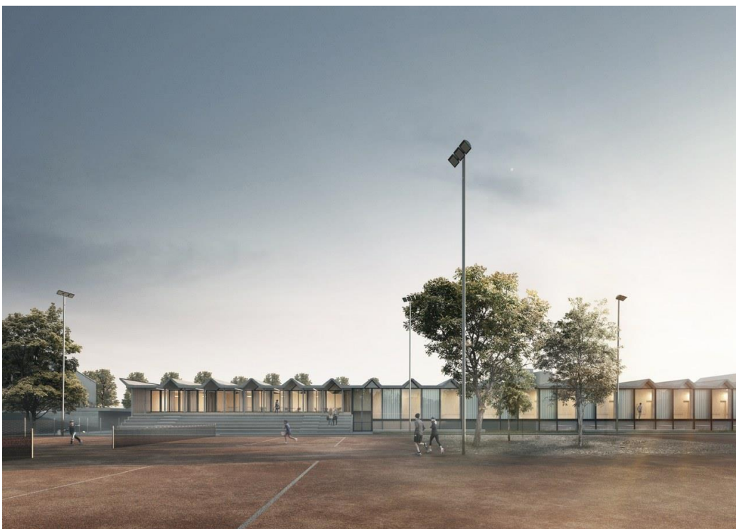
Bild unten: Linke Seite Clubhaus mit Aussentreppen, rechts Garderoben zum Hallenbad, Aussenbereich mit Bäumen.

Das Clubhaus des TC Neufeld wird ins Hallenbad-Gebäude integriert (ROT im Modell) und verfügt über einen eigenen Eingang. Mit den westseitig angeordneten Aussentreppen erhalten die zuschauenden Clubmitglieder eine kleine Tribüne mit gutem Ausblick auf den Center-Court und alle andern Tennisplätze oder Padeltennis-Plätze.